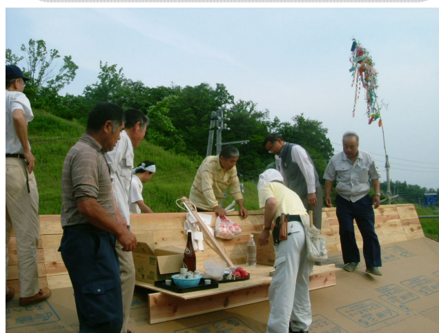
屋根の上での上棟式の様子