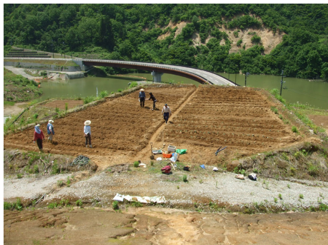
新宇賀地橋と畑づくり